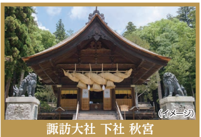
諏訪大社 下社 秋宮

●運送機関の遅延・欠航、交通渋滞その他の不可抗力の事由により到着・帰着時間が変更となる場合がございます。その場合、旅行日程の変更、もしくは目的地滞在時間の短縮または一部削除させていただく場合もございます。 ●バス座席は、基本お申し込み順とさせていただきます。