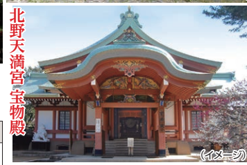
北野天満宮宝物殿 (イメージ)