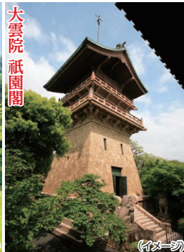
大雲院 祇園閣 (イメージ)