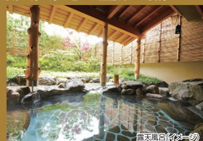
露天風呂(イメージ)