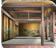
高台寺 客殿 完成イメージ (客殿完成イメージ)