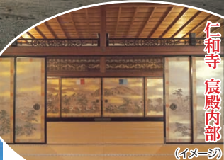
仁和寺 宸殿内部 (イメージ)