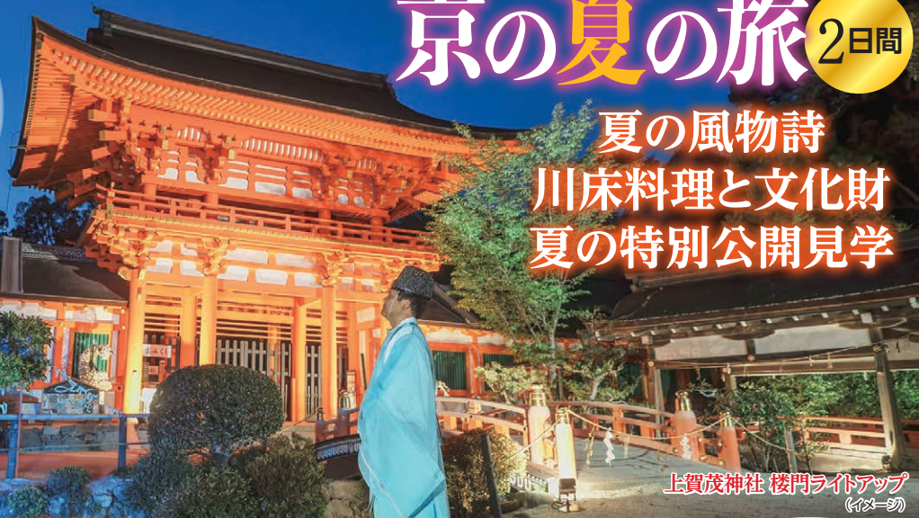
上賀茂神社 楼門ライトアップ (イメージ)