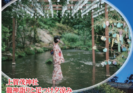
上賀茂神社 龍神詣りと足つけ夕涼み (イメージ)