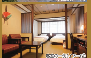
客室の一例(イメージ)