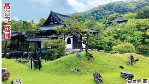
高台寺 庭園 (イメージ)