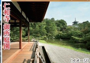
仁和寺 御所庭園 (イメージ)