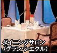
ダイニングサロン (グラン・シエクル)