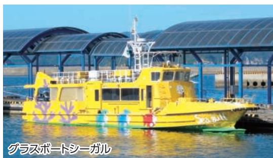
グラスポートシーガル