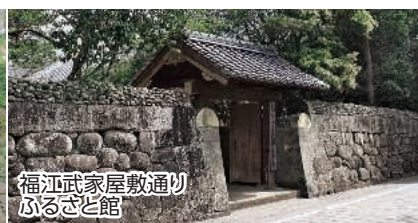
福江武家屋敷通り ふるさと館