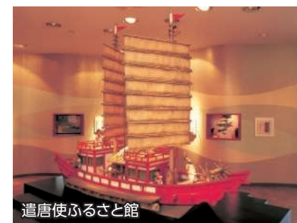
遣唐使ふるさと館