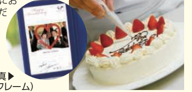
記念写真▶ (特製フォトフレーム)