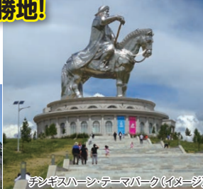
チンギスハーン・テマパーク(イメージ)